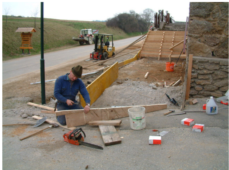
Die Eingangsstiege beim Jugendgästehaus wird erneuert

Ein wesentlicher Punkt dabei ist die Stiege beim Haupteingang, die umgestaltet und neu gepflastert wird. Ebenso werden der Zugang zum Jugendraum sowie beide Terrassen mit neuen Platten belegt. Bei den Eingängen zum Jugendgästehaus und beim