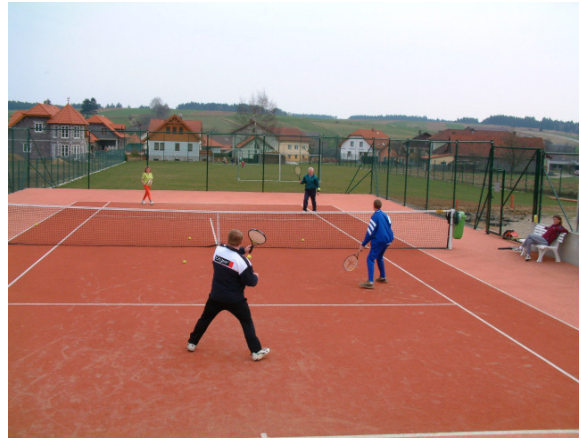
Tennisspielen in Sallingstadt möglich

Werden sie Mitglied bei der Tennisanlage in Sallingstadt!