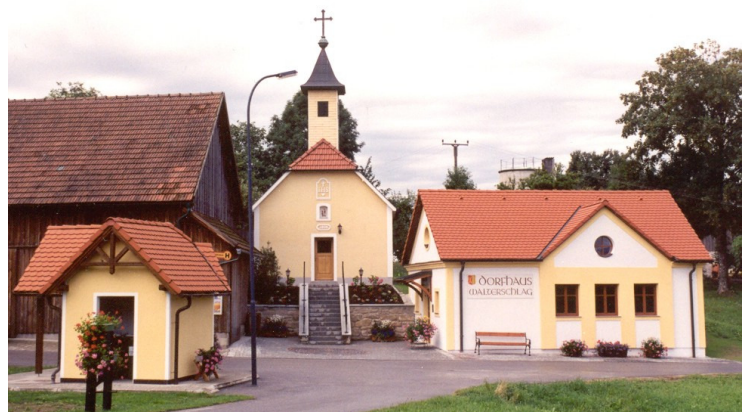
Der neue Dorfplatz von Walterschlag buhlt um die begehrte „Goldene Kelle“!

Unter dem Motto „jede Stimme zählt“ bitten wir alle, sich diese Broschüre zu besorgen und dem Projekt die Zustimmung zu geben. Bitte