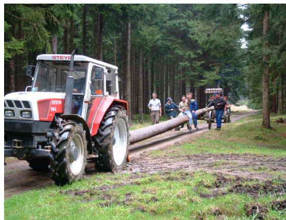
Maibaumholzen in Sallingstadt