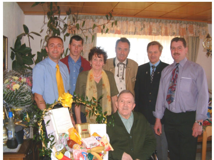
Die Gratulantenschar freut sich mit den Jubilaren

Die Mitwirkung im Singkreis ihrerseits ist sicher auch ein wesentlicher Beitrag zum Fröhlichsein.