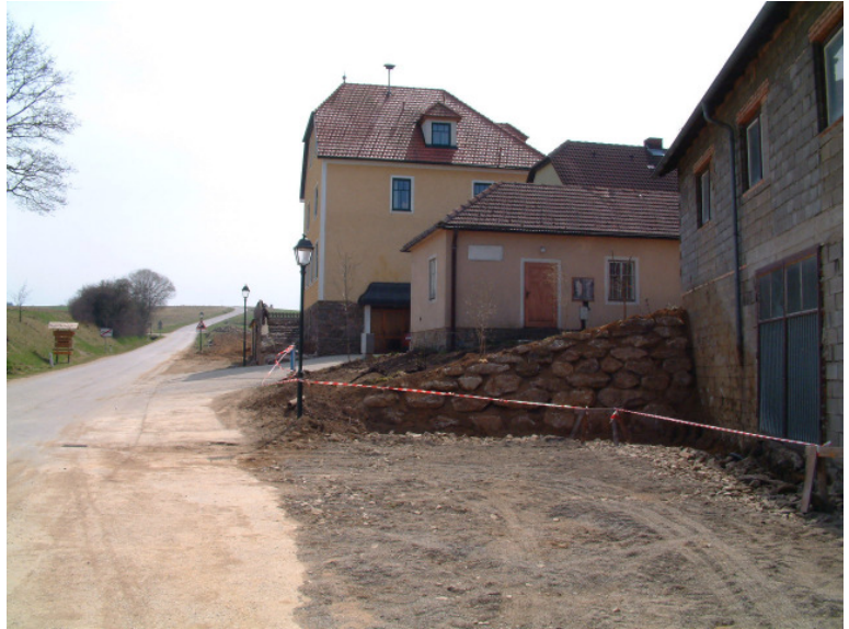
Die Bauarbeiten an der Walterschlägerstraße laufen voll an

Von der großen Brücke bis zum Jugendgästehaus wird ein Gehsteig angelegt, bzw. teilweise erneuert, soweit mit den Grundbesitzern eine Einigung erzielt wird. Der Straßenverlauf wird an den breiteren Stellen mit Tiefbordsteinen gekennzeichnet. Die Arbeiten tragen zur Verkehrssicherheit und zur Sicherheit der Fußgänger sehr wesentlich bei. Genauso wird zugleich auch der Vorplatz vor dem Feuerwehrdepot gänzlich