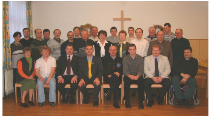
Der neue Vorstand des VV- Sallingstadt/Waltersschlag mit seinen Beiräten

Eines der größten Projekte des Vereines – das Dorfgemeinschaftshaus in Waltersschlag samt Vorplatz und Kapellenaufgang – konnte im vorigen August offiziell der Bestimmung übergeben werden. Dies wurde mit