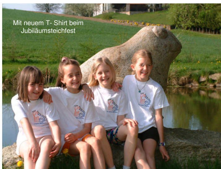
Mit neuem T- Shirt beim Jubiläumsteichfest