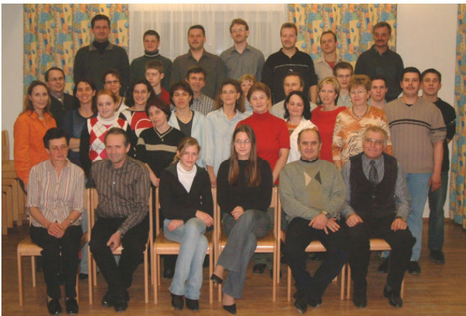
Gruppenbild aller Teilnehmer zum Abschluss des Tanzkurses 2004 in Sallingstadt

Im Rahmen des Bildungs- u. Kursprogrammes des Verschönerungsvereines Sallingstadt/Waltersschlag fand vom 9. November bis zum 21. Dezember 2004 ein Tanzkurs statt. Dabei erwies sich das Dorfzentrum mit dem Saal als sehr geeigneter Veranstaltungsort. An insgesamt 5 Abenden wurden den Teilnehmern die Grundschnitte der Tänze Rumba, Boogie, Langsamer Walzer, Tscha-Tscha-Tscha, Samba, Tango