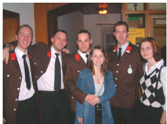
Stimmung herrschte beim diesjährigen Ball der FF Sallingstadt

Jahren! Mehr Bilder im Internet auf der Seite http://ff.sallingstadt.net/