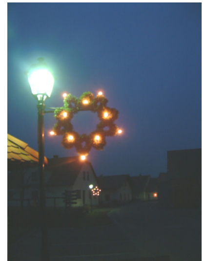
Die neuen Weihnachtssterne am Dorfplatz in Sallingstadt