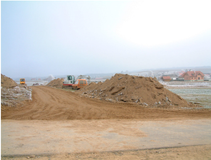
Durch die gute Wetterlage konnte noch im Dezember ein weiteres Wegstück geschüttet werden.

Der Weg vom "Kastanienbaum" bis zur Kreuzung Richtung Fam. Keindl wurde Mitte Dezember 2004 auf einer Länge von 250 m erneuert.