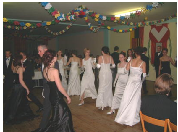
Die jungen Damen in ihren tollen Kleidern waren beim ÖVP-Ball schon ein herrlicher Anblick