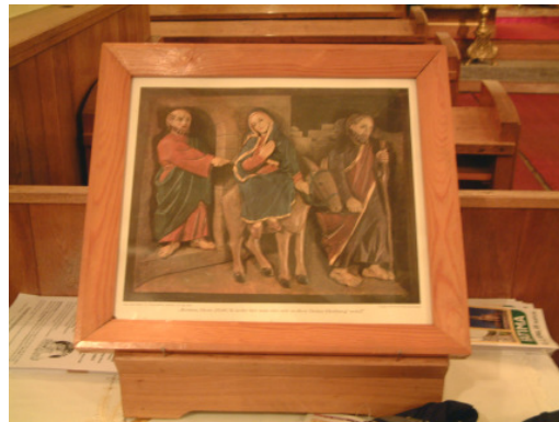
Dieses Bild der heiligen Familie ging in Sallingstadt und Walterschlag vor dem Weihnachtsfest auf Herbergsuche