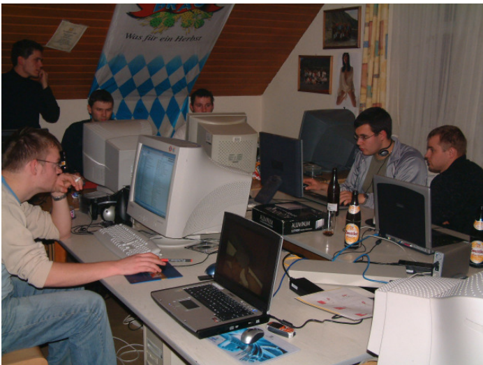
Bereits zum 5. Mal fand im Jugendtreff in Sallingstadt eine Netzwerkparty statt

Bereits zum 5. Mal organisierte die Junge ÖVP Ortsgruppe Sallingstadt eine Netzwerkparty vom 06. – 09. Jänner 2005 im eigenen Jugendraum. Dabei konnte jeder mitmachen, der Lust und Laune hatte, ohne Eintritt bezahlen zu müssen. Dazu brauchte nur der eigene PC mit Netzwerkanschluss und verschiedenes Kabelzeugs mitgenommen werden.