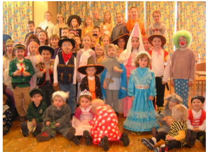
So viele waren gekommen, dass nicht alle Kinder auf das Erinnerungsbild passten

te für die Musik und die vielen lustigen Spiele. Der Kasperl fiel diesmal leider aus. Danke den vielen Spendern: Fa. Ergee, A&O Kaufhaus Weitzenböck, die Raiffeisenbank und die Sparkasse Schweiggers, A&O Kastner, Zwettler Bier; Viele Bilder davon finden sie im Internet auf www.sallingstadt.net unter Aktuelles!