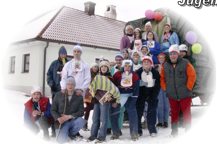
Lustiges Treiben beim Faschingsumzug der Dorfjugend

den sich sehr viele Mitglieder und Freunde der Ortsjugend ein, um für einen guten Zweck zu sammeln. Die Gesamteinnahmen werden diesmal gänzlich der Aktion „Nachbar in Not“ für die Flutopfer in Südostasien zur Verfügung gestellt.