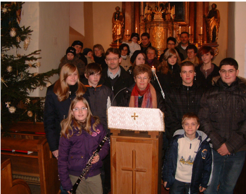
Die Mitwirkenden bei der Kindermesse um 16 Uhr in der Pfarrkirche