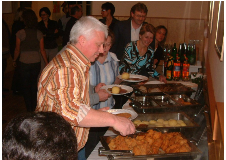
Das ausgezeichnete Buffet schmeckte vorzüglich

Zur musikalischen Unterhaltung wurden Schlager aus den 60iger und 70iger Jahren bis in den frühen Morgen gespielt.