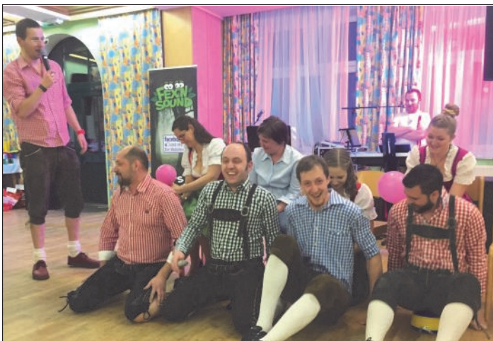
Verschiedene Spiele lockerten den Abend auf.