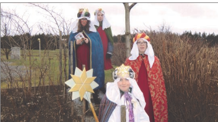
Die Sternsinger aus Walterschlag, die in Walterschlag und Windhof von Haus zu Haus zogen

Haus". Die Namen der drei Könige, Caspar ("Schatzmeister"), Melchior ("Mein König ist Licht") und Balthasar ("Schütze sein Leben"), wurden erstmals im 5. Jahrhundert genannt. Jeder König steht für einen der damals bekannten Erdteile: Afrika, Asien und Europa. Seit langem war es Brauch-