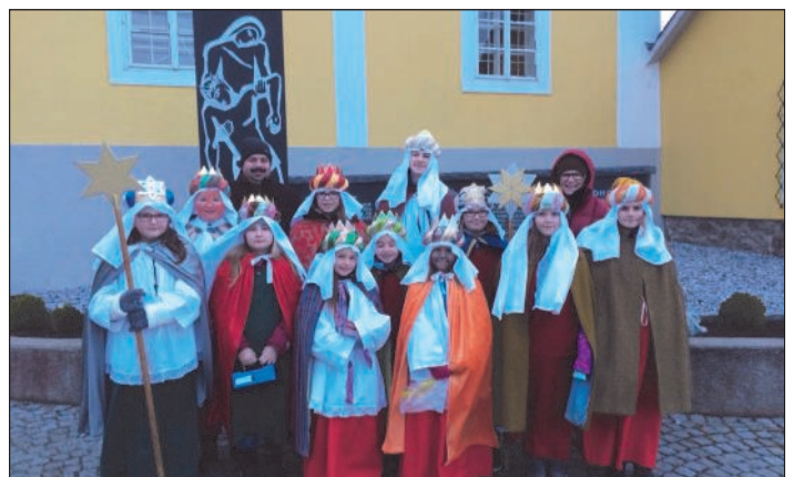
Gruppenfoto der Sternsinger aus Sallingstadt mit ihren Begleitern

tum, dass Neujahrssänger von Haus zu Haus gingen. Diese nahmen im Mittelalter die Rollen der drei Könige an. Ab dem 16. Jahrhundert war dies den Schülern, Studenten und Handwerksburschen vorbehalten, die mit den gesammelten Spenden ihre eigene Armut lin-