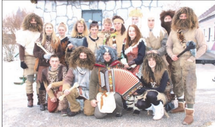
Das Gruppenfoto in Walterschlag.

Mit ihrer beheizten Höhle fuhren Sie durch die Orte Walterschlag und Sallingstadt, um dabei eines festzustellen: Auch wenn die Höhlen der Dorfbewohner anders aussehen und sie nicht mehr so schön gekleidet sind, ist die Gastfreundschaft noch immer die selbe. Sie wurden mit Getränken