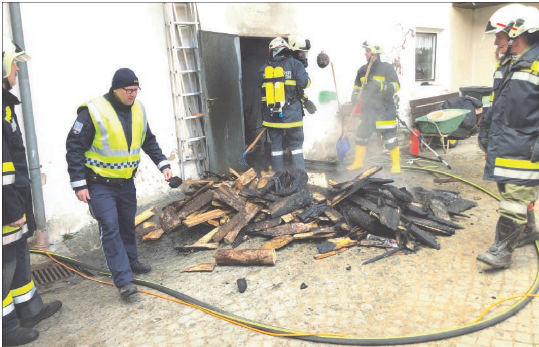
Gemeinsames Holz-Ausräumen aus dem Heizraum.

Per SMS-Benachrichtigung wurde die FF Sallingstadt am 9. März 2022 um 10:41 zur Bekämpfung eines Kellerbrands (B2) alarmiert.