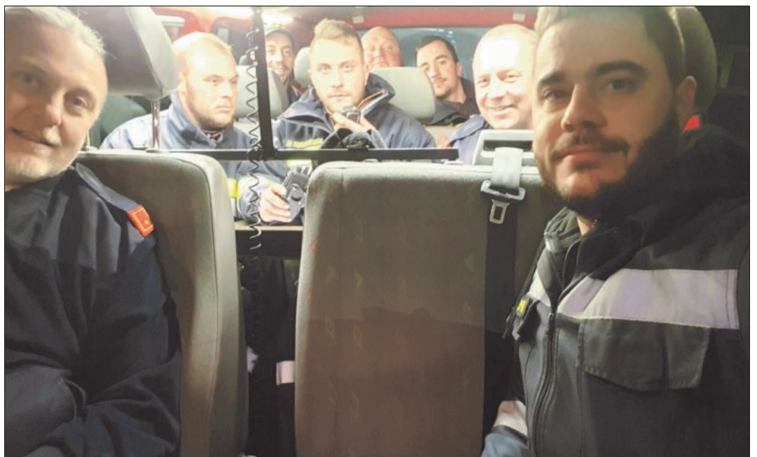
Zahlreiche Teilnahme bei der Funkübung.

tete Übung und an unsere Kameraden für die rege Teilnahme!