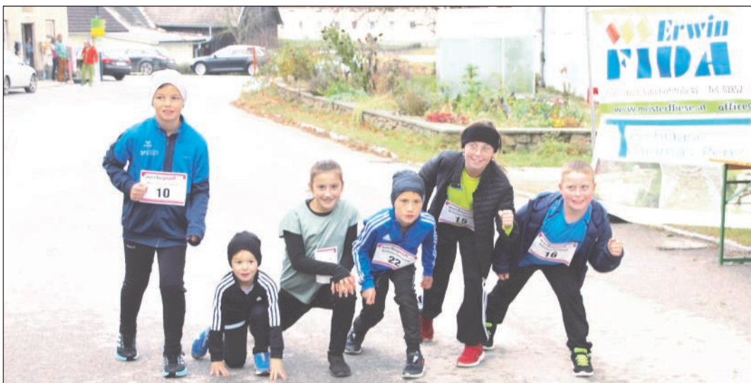
Auch die Kinder aus Sallingstadt waren am Start.

Auch 23 Nordic Walker marschierten bei der Labstelle in Walterschlag vorbei.