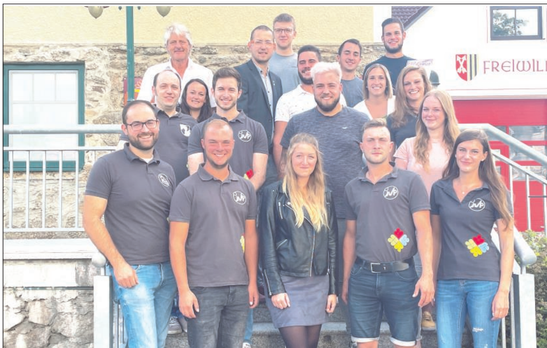
Gemeinsames Gruppenfoto beim Jugendgästehaus Sallingstadt

Am 12. September 2021 fand die Jahreshauptversammlung der JVP Sallingstadt statt.