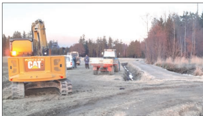
Gemeindewaldweg in Waltersschlag