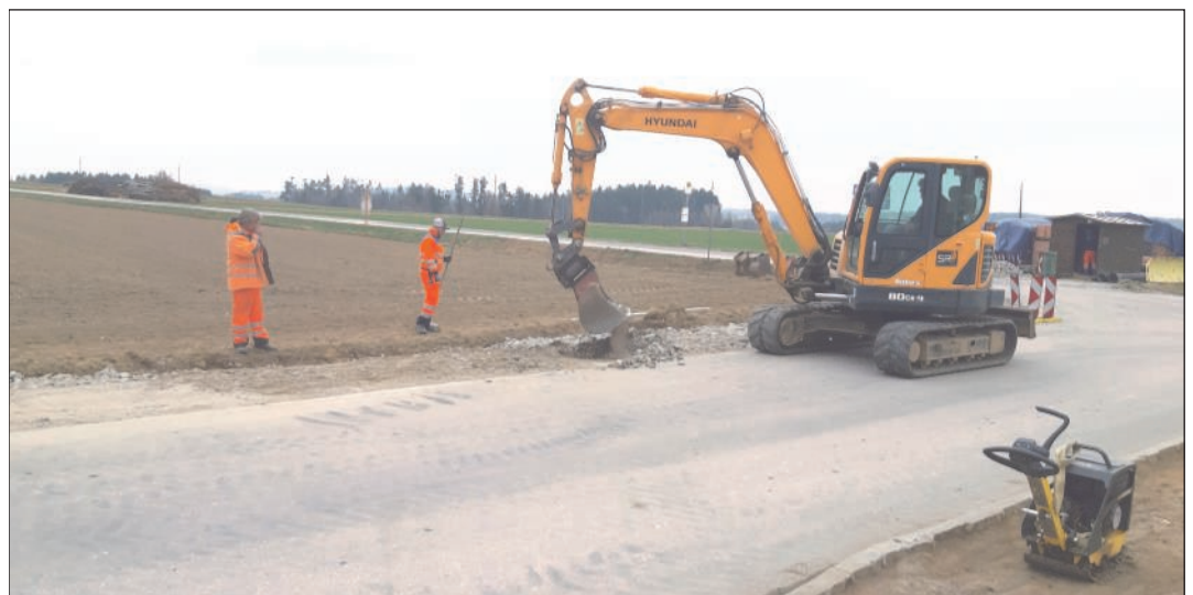
Baggerarbeiten an der Bushaltestelle

richtung Zwettl auch das Fundament für ein eventuell zukünftiges Wartehaus hergestellt.