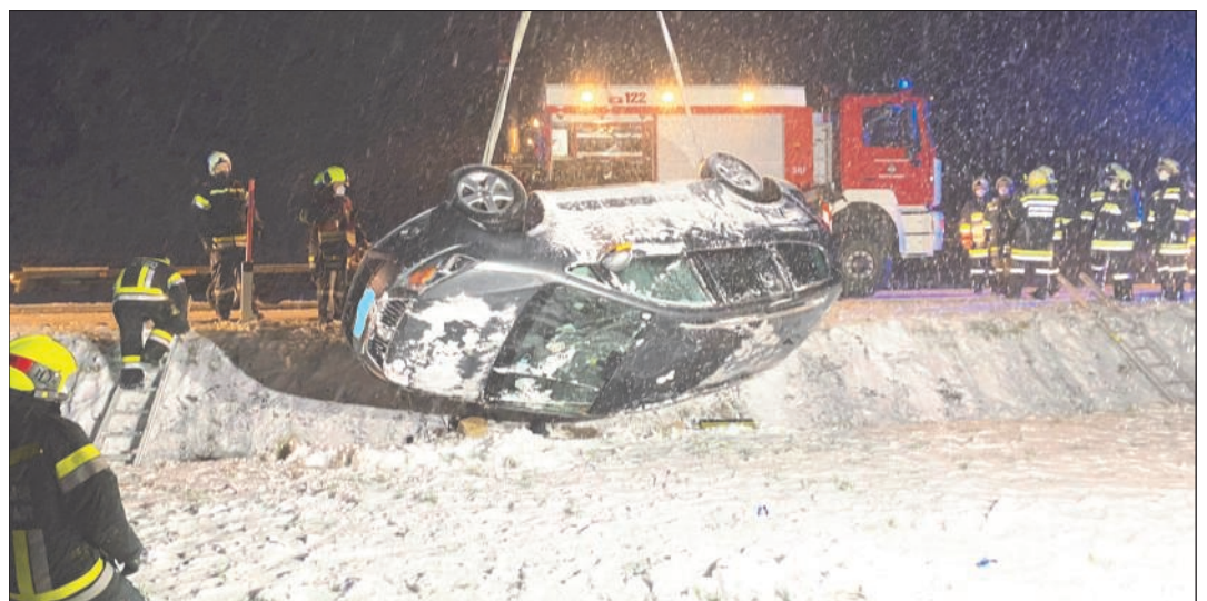
Die FF Sallingstadt übernahm die Absicherung der Unfallstelle.

Während die FF Limbach gemeinsam mit der FF Gr. Globnitz die verletzte Person aus dem PKW rettete, übernahm unsere Wehr die Absicherung der Unfallstelle und den Brandschutz. In Reserve für die Rettung der verletzten Person war die FF Schweiggers vor Ort. Die FF Zwettl-Stadt übernahm die Bergung des verunfallten PKWs.