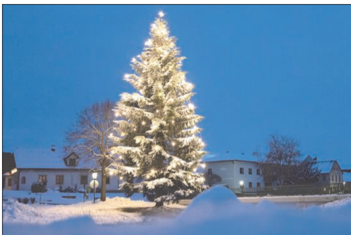
Die traditionell beleuchtete große Tanne in der Dorfmitte.

Bereits zum sechsten Mal wurde die große Tanne in der Sallingstädter Dorfmitte mit einer Lichterkette behängt. Viele helfende Hände kamen am Nachmittag des 28. November wieder zusammen, um mehr Adventzauber in den Ort zu bringen. Dafür gab es auch eine kleine Verpflegung. Auch am Vormittag wurde bereits Vieles geschafft. Vor dem Haus Hölzl/Hipp 27 wurde ein Eislaufplatz aufgebaut, der den Kindern und Er-