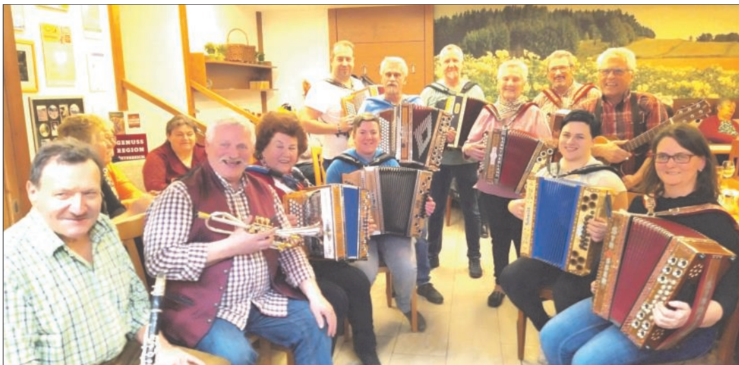
Viele Musiker aus Nah und Fern kamen wieder zum "Klingenden Wochenteilen" nach Sallingstadt

Unser "Klingendes Wochenteilen" war wieder ein toller Erfolg! Mit 17 Musikern konnten wir unser "Klingendes Wochenteilen" als Faschingsausgabe im Dorfwirtshaus Sallingstadt feiern. Diesmal hatten wir sogar einen Klarinettenspieler aus Guglwald in Oberösterreich dabei. Er nahm eine Fahrzeit von eineinhalb Stunden in Kauf, um mit uns die Woche musikalisch zu teilen. Es war wieder gewaltig und wir dürfen uns bei allen Mitwirkenden und Besuchern ganz herzlich bedanken!