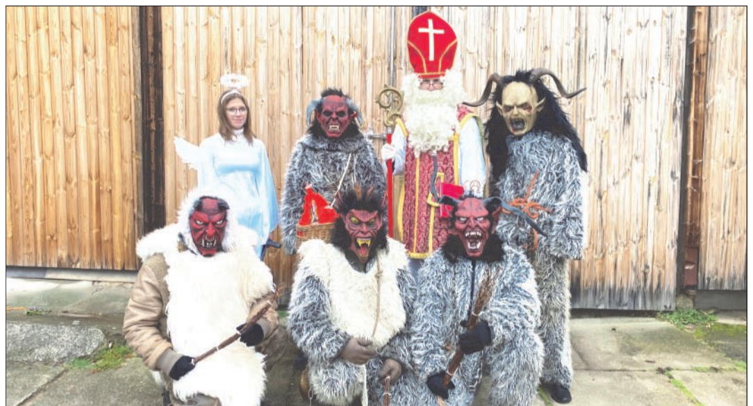
Der Heilige Nikolaus in Begleitung von Krampussen und Engerl.

Alle braven Kinder erhielten dabei ein Sackerl prall gefüllt mit Nüssen, Mandarinen, Äpfeln und Schokolade. Die schlimmen Kinder bekamen Besuch von den Krampussen. Auch ein Engerl flog mit dem Nikolaus durch die Orte, um ihm bei der Arbeit zu helfen. Die JVP Sallingstadt hofft, allen Kindern und Eltern eine Freude bereitet zu haben und freut sich schon auf nächstes Jahr.