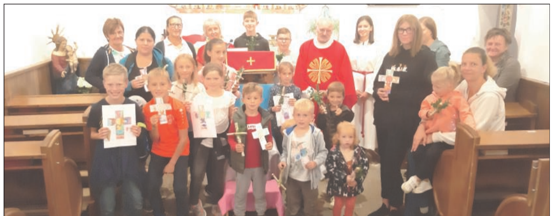
Die Kinder präsentieren ihre Kunstwerke, die nach der Segnung mit nach Hause genommen wurden.

melten. Schlusspunkt des Gottesdienstes war die Segnung der gemalten Bilder und der gebastelten Kreuze.