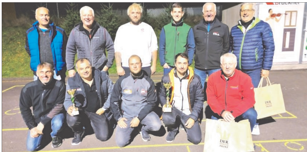
Die 3 Sallingstädter Mannschaften beim Juxturnier 2022.

Hingegen beim Juxturnier, am 21. Oktober schlug dann die Mannschaft Jugend Sallingstadt so richtig zu und konnte das Turnier für sich entscheiden! Bei diesem Turnier traten insgesamt 14 Hobby - Mannschaften an, darunter drei Mannschaften aus Sallingstadt. Neben der Jugend als Sieger, stand auch noch die Gruppe Tennis Sallingstadt mit Platz drei am Stockerl. Zweiter wurde die Firma Blauensteiner. Die Gruppe VV- Sallingstadt erreichte den fünften Platz. Zu Gewinnen gab es tolle Preise, gesponsert von Firmen aus der Region Schweiggers.