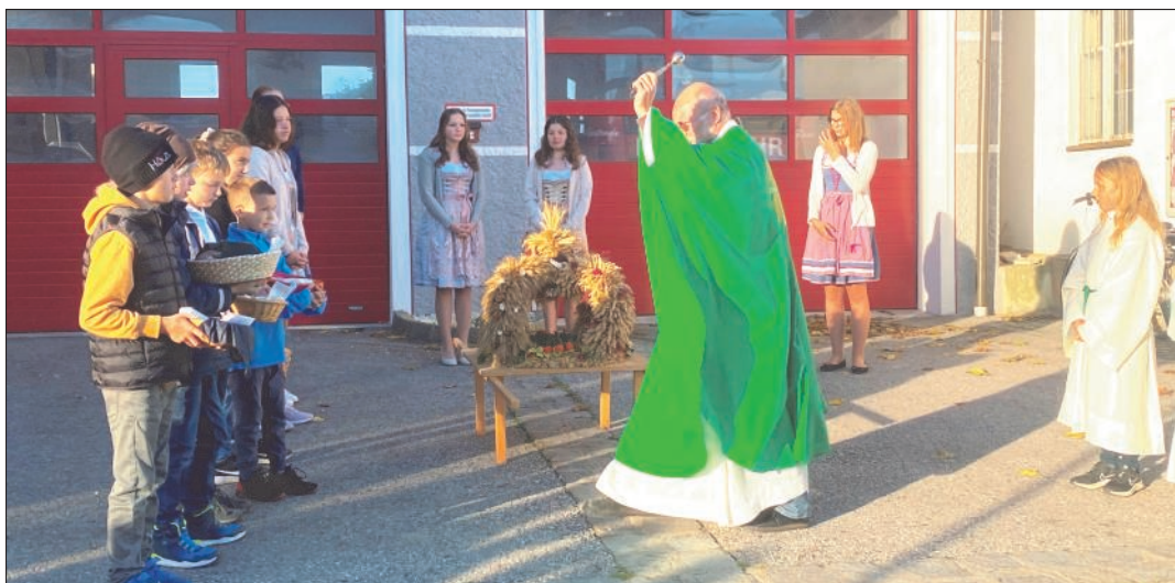
Segnung der Erntekrone vor dem Feuerwehrhaus

im Dorfwirtshaus Sallingstadt bestens gesorgt. Der Verschönerungs- und Wanderverein organisierte einen Bauernmarkt, bei dem Kaffee und Kuchen, frisches Geselchtes, Käsespezialitäten, diverse Holzkreationen, Schmuck und Accessoires aus Epoxidharz, selbstgemachte Handsachen, Honigprodukte sowie Produkte der Naturbar Rabl geboten wurden. Neu war dieses Jahr, dass der Verschönerungsverein, wie es einst einmal war, für den Verkauf des Geselchtes sorgte. Zum Mittagstisch bot die Küche des Hauses Wildspezialitäten und andere Hausschmankerl.