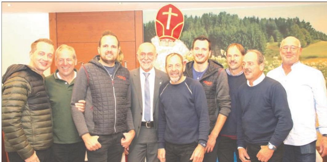
Nikolaus zu Besuch bei den Zellberg Buam und die Fetzig'n

Ein wundervoller Abend, der uns noch lange in Erinnerung bleiben wird!