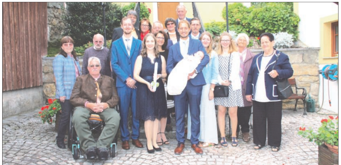
Foto vor der Kapelle in Walterschlag

geladen. Wir wünschen dem Paar und ihrem Sohn alles erdenklich Gute für ihr gemeinsames Leben!